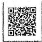
โคราชเมืองสะอาด เก็บกวาดทั้งจังหวัด ๑