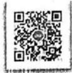
โคราชเมืองสะอาด เก็บกวาดทั้งจังหวัด ๒

สำนักงานส่งเสริมการปกครองท้องถิ่นจังหวัด กลุ่มงานส่งเสริมและพัฒนาท้องถิ่น โทรศัพท์/โทรสาร ๐ ๔๔๒๔ ๘๘๐๓