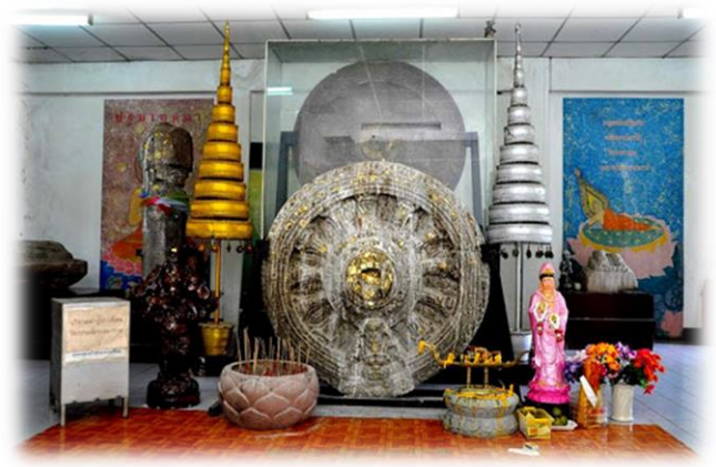
“ธรรมจักรล้ำค่า”