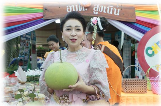
“ส้มโหวานรستی”