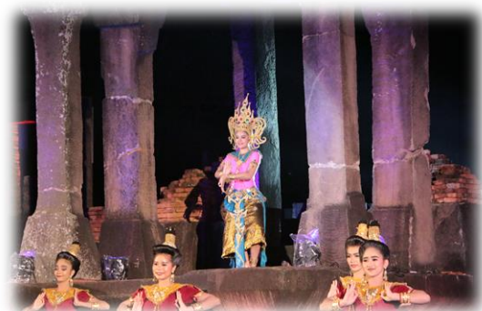
“ประเพณีกินเขาคั่ว”