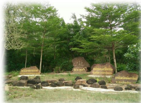
“แดนธรรมะวงแก้ว”