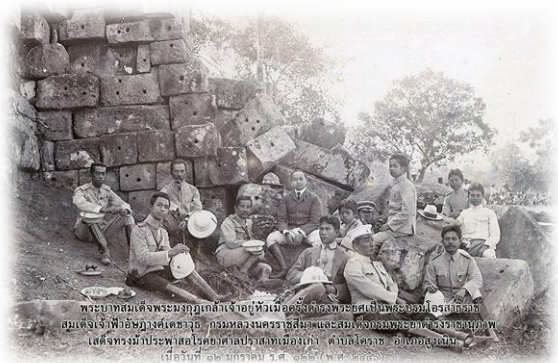
พระบาทสมเด็จพระมงกุฎเกล้าเจ้าอยู่หัวเมื่อครั้งดำรงพระยศเป็นพระบรมโอรสาธิราช สยามมกุฎราชกุมารทรงนำพระเศียรของสมเด็จพระนเรศวรมหาราชคืนเมืองเดนมาร์ก เมื่อวันที่ ๑๒ มกราคม ร.ศ. ๑๒๒ (พ.ศ. ๒๔๘๖) ทรงนำพระเศียรไปคืนเมืองเดนมาร์ก เมื่อวันที่ ๑๒ มกราคม ร.ศ. ๑๒๒ (พ.ศ. ๒๔๘๖) ทรงนำพระเศียรไปคืนเมืองเดนมาร์ก