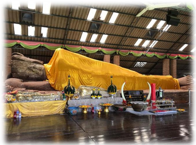
“พระพุทธไสยาสน์ศิลา”