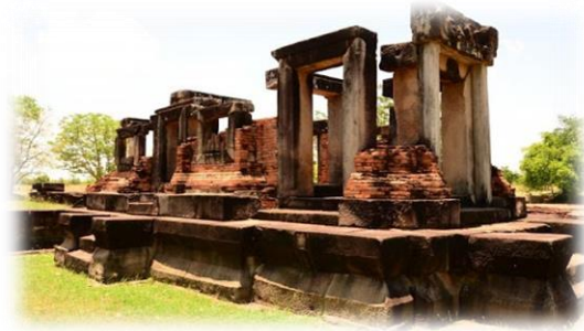
“ปราสาทหินโบราณ”